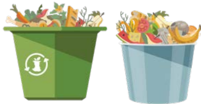
SPU(시애틀 공공사업부) 제공 음식물 쓰레기통